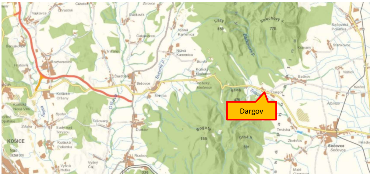
Obrázok č.:1 Poloha obce Dargov

Poloha a dostupnosť Kataster obce sa rozprestiera na juhovýchodnom úpätí pohoria Slanské vrchy na styku s Východoslovenskou pahorkatinou v doline potoka Trnávka. Obec leží 19 km západne od okresného mesta Trebišov a 30 km východne od krajského mesta Košice, na hlavnej dopravnej trase regiónu – ceste prvej triedy číslo I/19. Kataster obce hraničí na východe s mestom Sečovce, severovýchode s katastrom obce Bačkov. južnú a juhovýchodnú hranicu katastra tvoria obce Trnávka a Malé Ozorovce. Na západe obec hraničí s obcami okresu Košice-okolie a to Svinica, Košický Klečenov, Nižná Kamenica a vyšná Kamenica. Na severe sa kataster dotýka územia obce Banské z okresu Vranov nad Topľou.